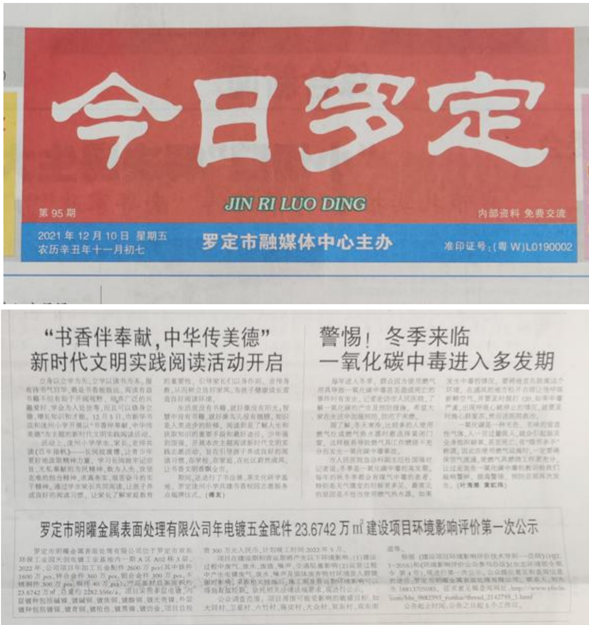
图 3.2-2 征求意见稿形成后第一次报纸公告截图