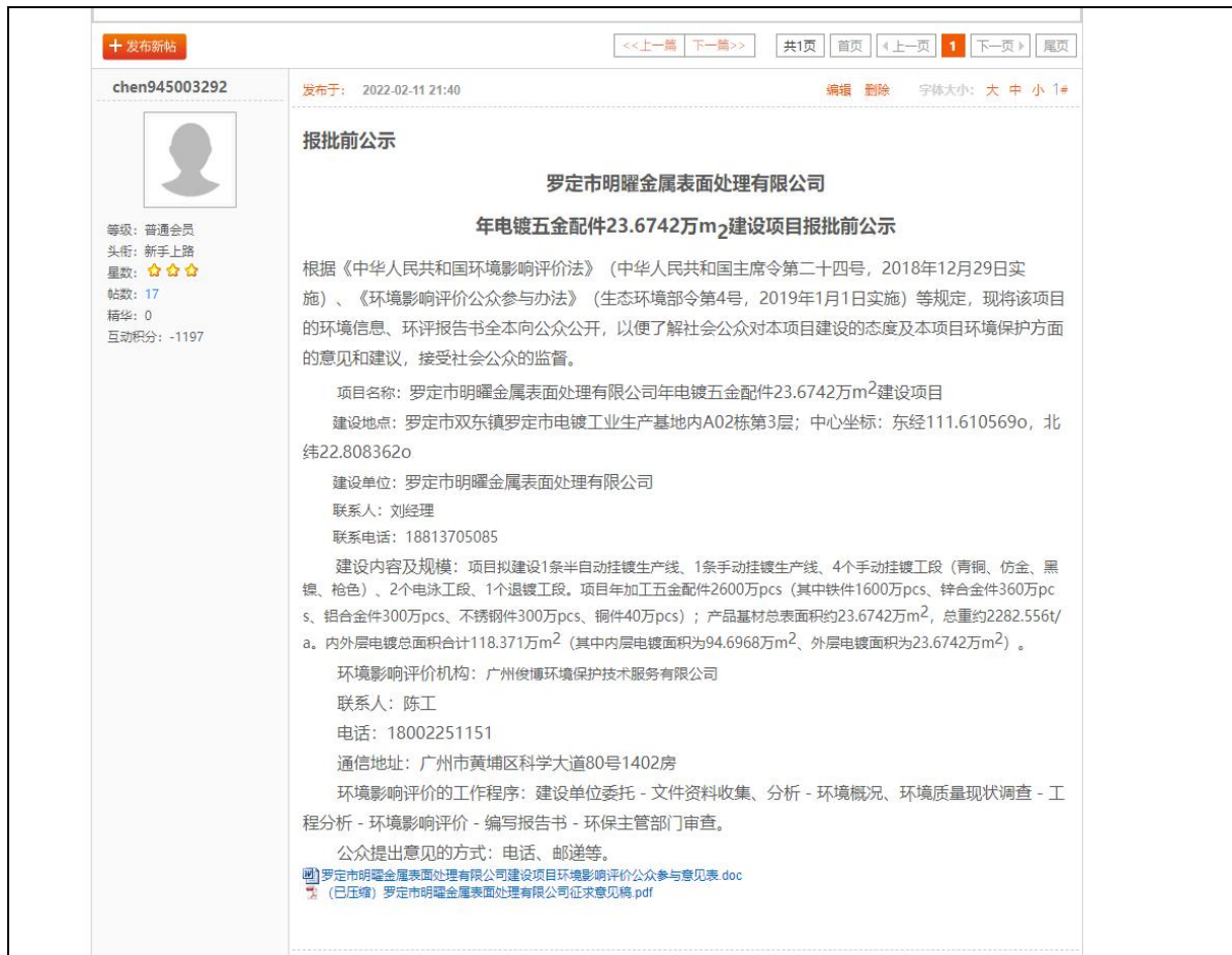
图 6.2-1 报批前项目网络公开截图