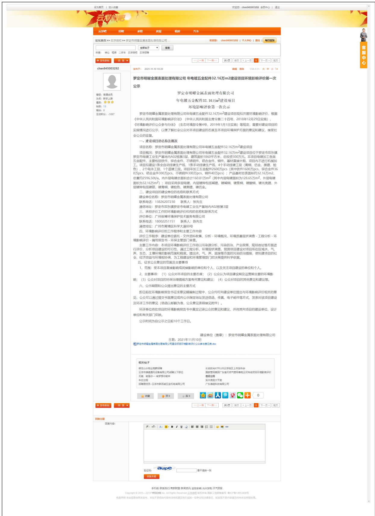
图 2.2-1 首次环境影响评价信息公开截图