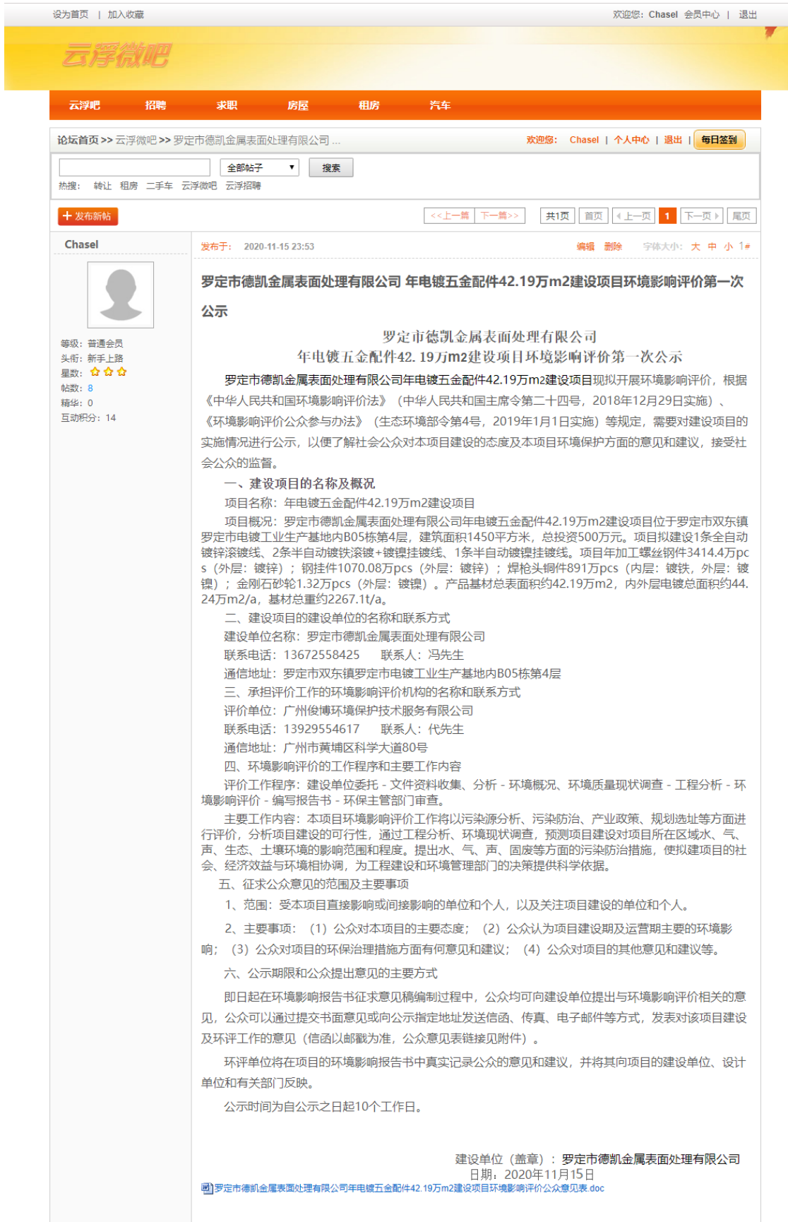
图 1 第一次网络公示截图