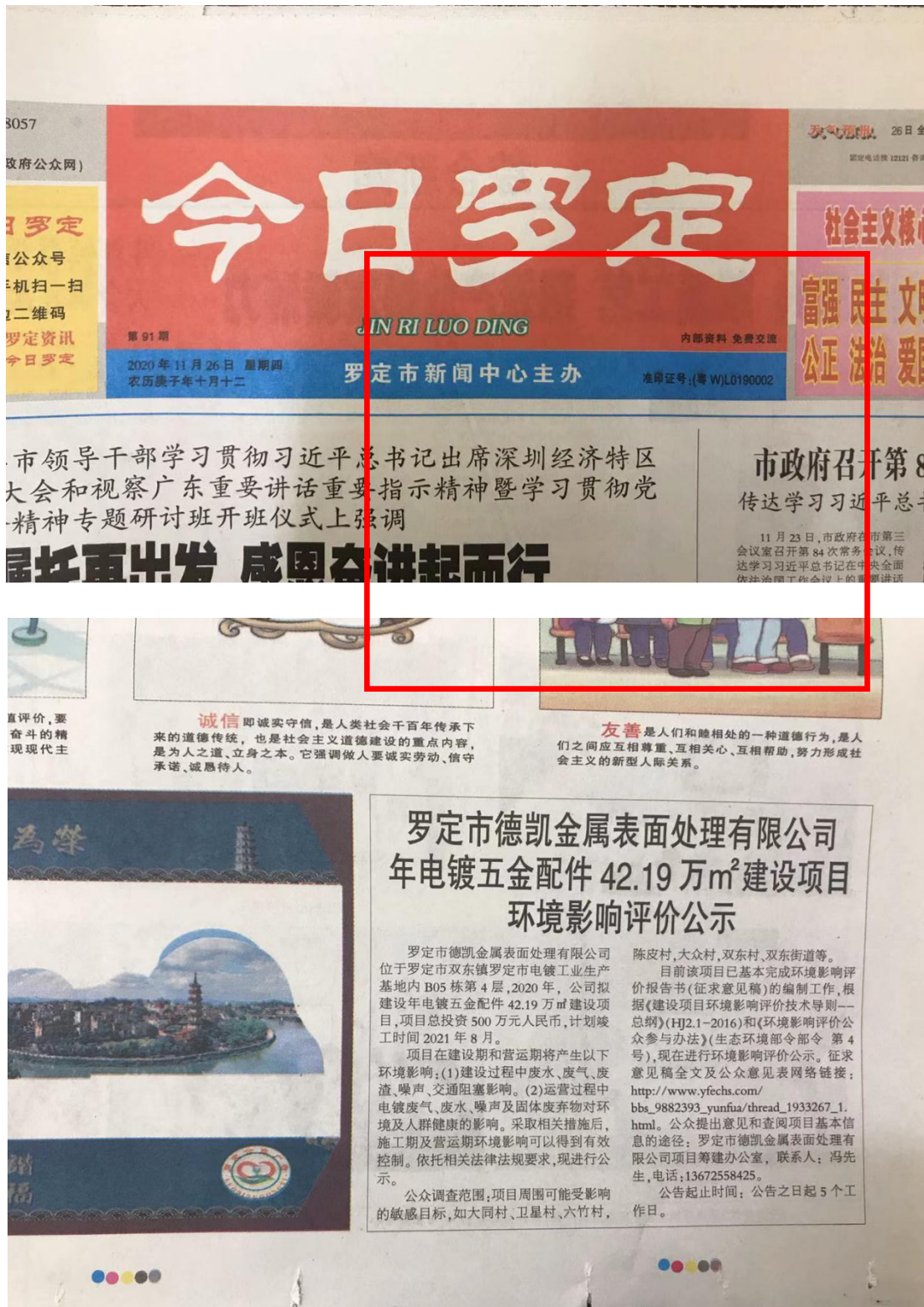
图 4 报纸公示（2020 年 11 月 26 日）

《今日罗定》为罗定市的主流纸媒，在本区域发行量较大，属于公众易于接触的报纸，符合《环境影响评价公众参与办法》（生