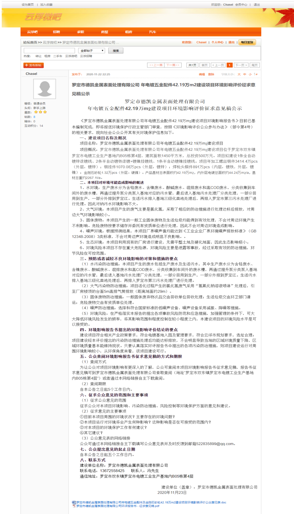
图 2 第二次网络公示截图